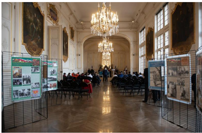
Une vue de l'exposition sur l'épopée "LECLERC" et la 2 ème Division Blindée dans la salle des fêtes de la mairie.