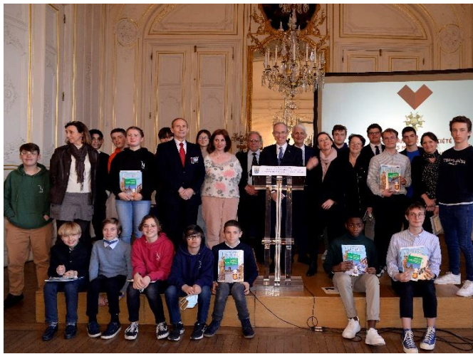
Photo de groupe des autorités avec les élèves et leurs professeurs après la remise des prix récompensant leurs travaux sur le thème "les jeunes des Yvelines sur la voie de la 2 ème DB".