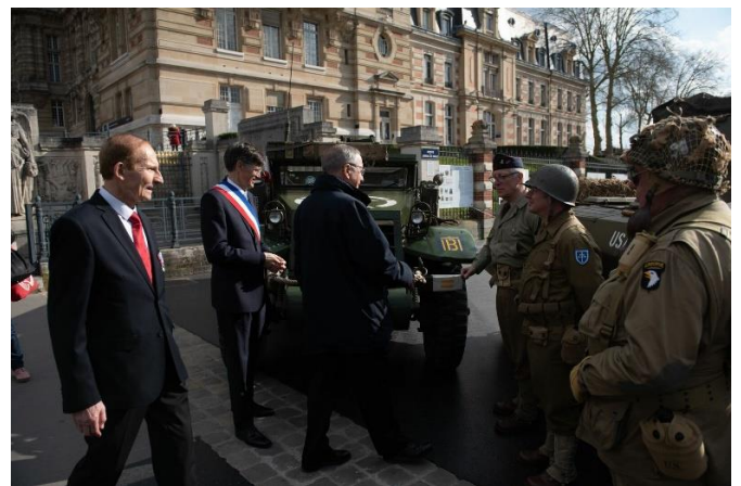
Les autorités devant les véhicules militaires de l'association des amis de la 2 ème DB