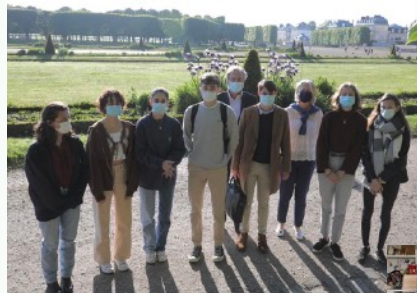
Équipe de la ville

Notre Comité a pu constituer deux équipes : l'une avec des étudiants de SciencesPo Saint-Germain et l'autre aux couleurs de la Ville avec des jeunes des lycées Jeanne d'Albret, Saint Augustin et deux étudiants de SciencesPo.