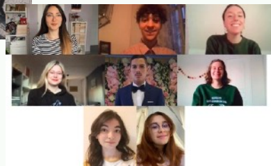
Équipe de Sciences Po

Nous leur souhaitons de réussir à décrocher un des nombreux prix et sommes persuadés qu'après cette expérience ludique, ils seront des ambassadeurs de nos valeurs auprès de leurs amis.