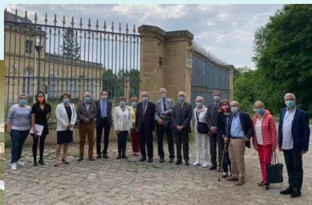
Visite de membres de la section 78