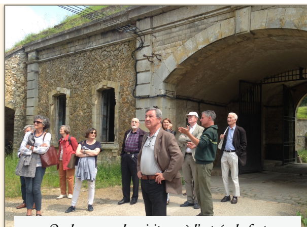
- Quelques-uns des visiteurs à l'entrée du fort -