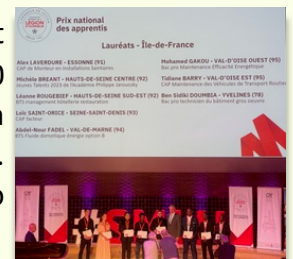
Les 8 lauréats de l'Île-de-France

Olympiades 2024 : Le projet est officiellement lancé. A l'instar des Olympiades 2021, il s'agit de constituer de l'ordre de 150 équipes de Jeunes. Chaque équipe doit être formée de 8 jeunes Lycéens impérativement encadrés par un membre enseignant de leur établissement. Il est demandé à chaque section de proposer au moins 3 équipes. Les Olympiades comportent, comme en 2021, deux phases : la première numérique qui se déroule du 15 janvier au 15 mai où les équipes doivent répondre à un QCM préparé par chacun des partenaires de la SMLH : institutions, associations, ... La deuxième phase se déroulera en présentiel le 26 mai au stade Charlety où les partenaires disposeront chacun d'un stand. Les équipes choisiront 6 stands où des épreuves les attendront.