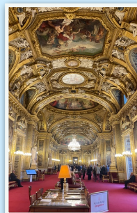
La salle des conférences

La visite s'est conclue par un excellent dîner dans une ambiance très conviviale.