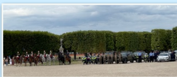
Vue générale de la cérémonie

Nous le remercions vivement pour les excellentes relations qu'il a su tisser avec notre Association.