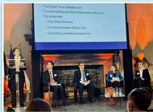
Présentation des résultats des travaux par les étudiants

https://archive-ouverte.unige.ch/unige:157551