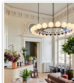
Les salons du Château du Val