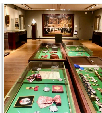
Musée de la Légion d'Honneur